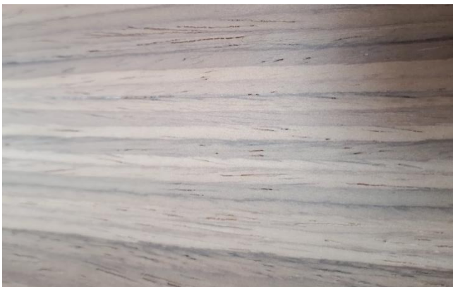
Фото «открытой поры» после отделки ЛКМ

При финальной отделке мебели из шпона применяется вариант обработки, называемый «открытая пора»: поры при отделке частично заливаются одним слоем лака по грунту. Таким образом визуально и тактильно подчеркивается природное происхождение материала – текстура древесных волокон, натуральность и естественная красота.